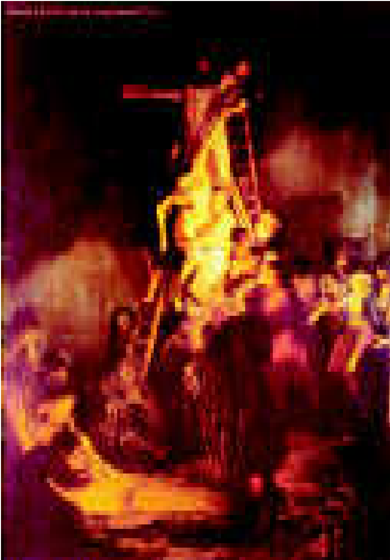
Rembrandt: Ristiltä ottaminen, v. 1634

Meidän ei tarvitse mennä kauaksi etsimään köyhiä. Heitä on kaikkialla.