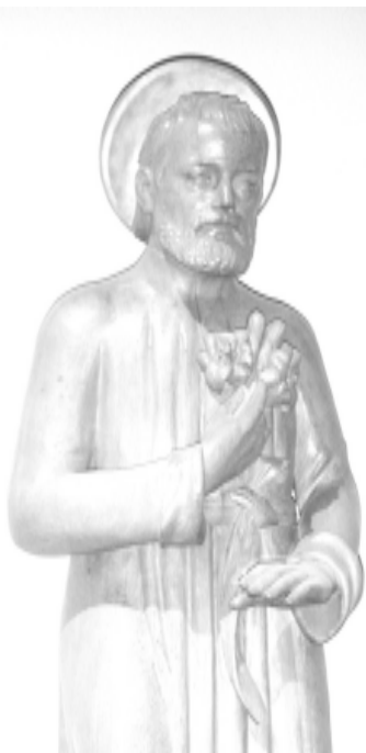
Hiljainen suuruus on kymmenosainen miehistikely pyhästä Joosefista. Se on alunperin ilmestynyt itävaltalaisessa St. Josef -lehdessä (Heft 6, 2001).

Ensi sijassa Joosef, pyhän neitsyden puoliso, on oikeudenmukainen. Hän on oikeudenmukaisuuden mies. Hänen persoonallisuutensa rikkaus ja syvyys tulevat näkyviin tuossa yhdessä sanassa, jonka evankeliumit hänelle osoittavat. "Ihmisen todellista arvoa ei voi mitata viettelevistä menestyksistä saadun katinkullan, vaan sisäisen järjestyksen ja hyvän tahdon määrällä."