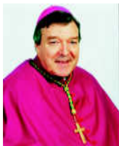
Sydneyn arkkipiispa tri George Pell

Tri Pell kiitti maallikoiden toimintaa, kuten karismaattisia liikkeitä, neokatekumenaaleja, Emmanuel-yhteisöä ja Opus Deitä, koska ne tarjoavat selkeää kristillistä opetusta, tukevat pavia ja pappetta ja keskittyvät Kristukseen. Samalla ne tukevat yhteisöinä toisiaan.