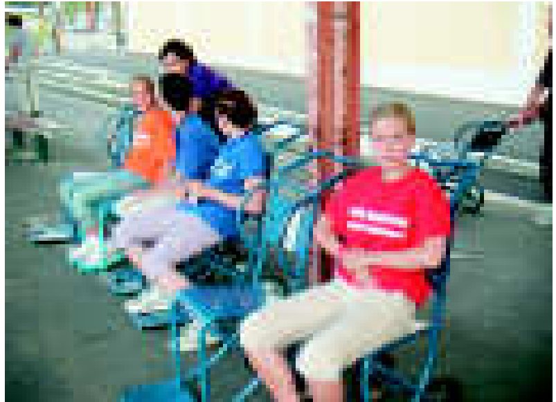
Kohta se sairaalajuna tulee - ryhmän nuoret kuljettivat sairaita juna-asemalla

Lourdesin matka tuntui todelliselta pyhiinvaellukselta vaikka matkustimmekin paikalle lentokoneella. Koko vaelluksen aikana oli erityisen kuumaa (n. 40 °C) ja asuimme vielä korkean mäen päällä, jonne kiipeämi-