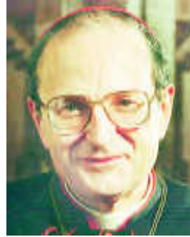
Kardinaali Joachim Meisner saapuu Suomeen paavi Johannes Paavali II:n legaattina helmikuun lopussa. Hän osallistuu kymmenien ulkomailta saapuvien vieraiden kanssa hiippakunnan juhluvuoden päätapahtumiin Pyhän Henrikin katedraalissa.