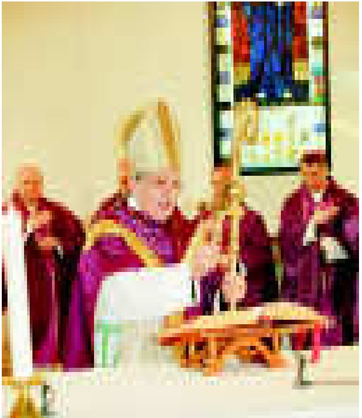
Paavin legaatti, Kölnin arkkipiispa kardinaali Joachim Meisner antamassa krusifiksilla apostolista siunausta hiippakunnan juhluvuoden päätapahtumassa Pyhän Henrikin katedraalissa sunnuntaina 27.2.2005.