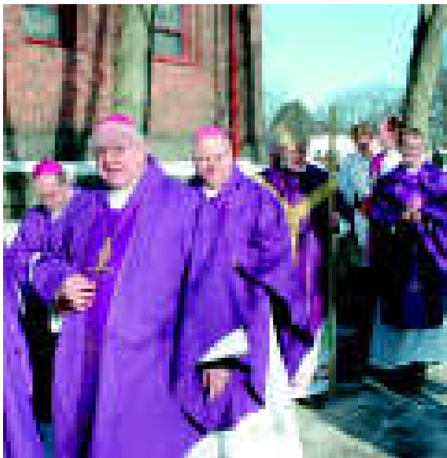
Juhlamessun päätteeksi liturginen kulkue saapui pappilan pihaan aurinkoisessa kevättalven säässä. Messun jälkeen oli tilaisuus ajatusten ja kuulumisten vaihtamiseen, kuten alakuvassa tekevät veljellisesti kardinaali Meisner ja Opus Dein prelaatti, piispa Javier Echevarría. Juhlaviikonlopon lämminhenkinen tunnelma kaikui kauniisti kardinaalin saamassa: "850 vuotta Jumalan ylistystä, se on Teille todellinen perintö ja varma takuu."

+ KARDINAALI JOACHIM MEISNER KÖLNIN ARKKIPIISPA PAAVIN LEGAATTI