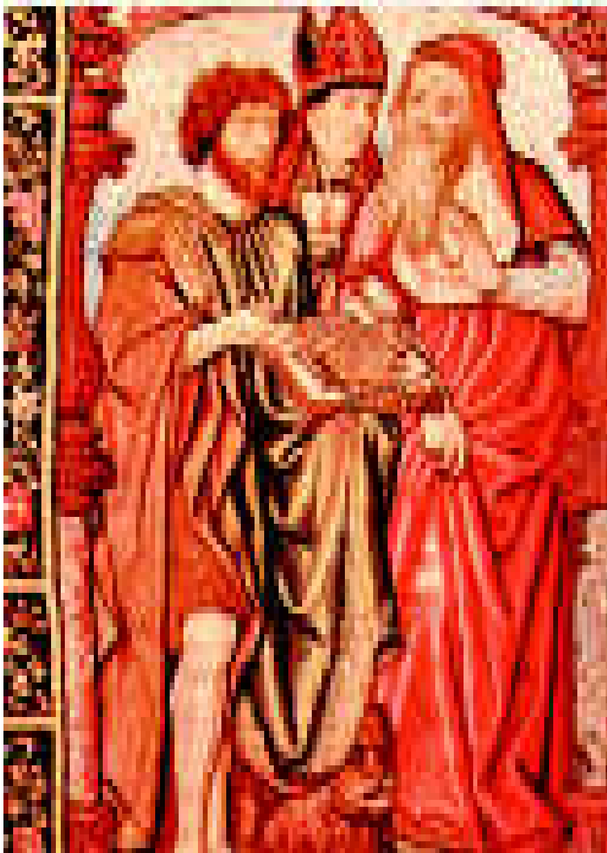
1500-luvun alun villa- ja silkkikangastyö Flanderista. Sen yksityiskohtana on kuva pyhästä Johannes Kastajasta kädessään kirja ja lammas (vas.), pyhä Augustinus kädessään oma sydämensä ja pyhä Hieronymos edessään leijona. Pyhän Johannes Kastajan mestauksen muistopäivää vietetään 29.7.