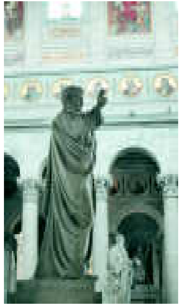
San Paolo fuori le mura: Pyhän Pietarin patsas näyttää osoittavan mosaikkista tehtyjä paavien muotokuvia, niiden joukossa myös edesmenneen paavimme Johannes Paavali II:n kuva, nyt kuolinvuodella täydennettynä.

Lauantaina vierailimme Birgittalaisisarten luostarissa. Saimme mahdollisuuden tutustua luostariin, viettää mes-