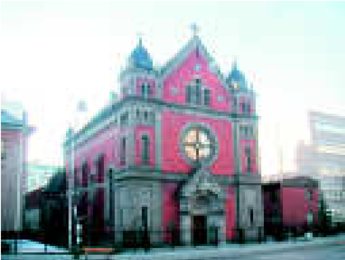
Under högmedeltiden, från elfte till och med trettonde seklet, fanns det förhållandevis många heliga kungar i Europa. Nämnas kan t.e.x. kung Stefan av Ungern på 1000-talet och Ludvig den helige av Frankrike på 1200-talet. I Norden hade vi också heliga kungar: Knut i Danmark, Erik i Sverige och Olof i Norge. Här ser vi St. Eriks katedral i Stockholm.

När det blivit lugn i riket samlade han en här och for på korståg till Finland = Egentliga Finland. Korståg var vid 1100-talets mitt nästan en modetrend. Utom det andra korståget till det Heliga landet sattes 1147 också ett verkligt korståg igång mot vänderna i Mecklenburg och Pommern. I det deltog flere nordtyska furstar och de danska kungarna Knut och Sven. Med sig på det finska korståget hade kung Erik biskop