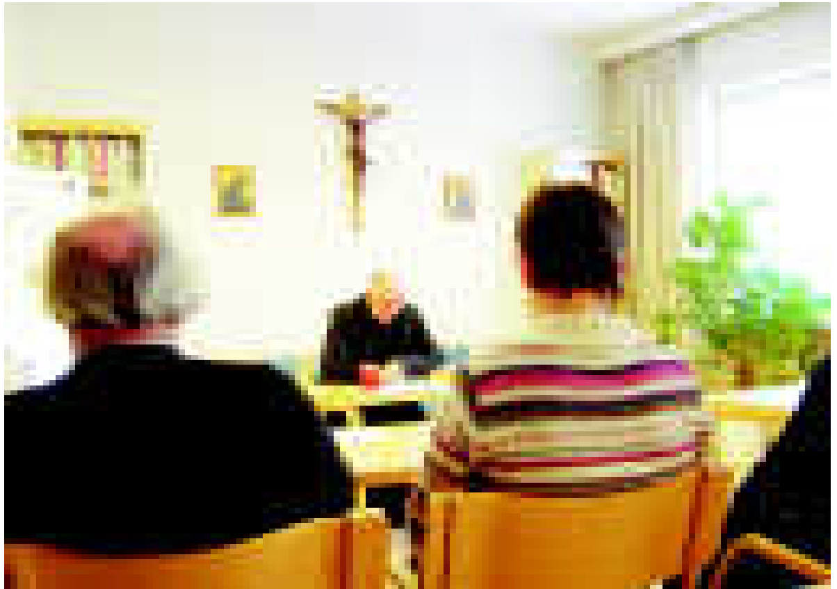
"Jumala pyytää meiltä vain rakkauttamme. Hän antaa meille uuden sydämen ja uuden hengen. Mystikot ja pyhät antavat sydämensä ja sielunsa Jumalalle. Yksinkertainen rukous, esimerkiksi ruusukko, pitää meitä yhteydessä Jumalaan ja auttaa keskittymään Häneen."

Jumala voi tehdä meidät osallisiksi omasta pyhyydestään. Hän kutsuu ihmisiä kaikista kansakunnista ympäri maailmaa olemaan osallisia ja muodostamaan kirkkoa. Eroa ei tehdä ihmisen ihonvärin tai jonkin muun ominaisuuden perusteella. Me kaikki olemme Jumalan uskollisia lapsia täyttämässä Hänen tahtoaan. Palvoessamme ja kumarttaessamme Häntä, olemme kiitollisia siitä, että olemme Hänen luomiaan. Yhteytemme Kristukseen syvenee, kasvamme Hänen tuntemisessaan ja seuraamme Häntä. Vapaudumme