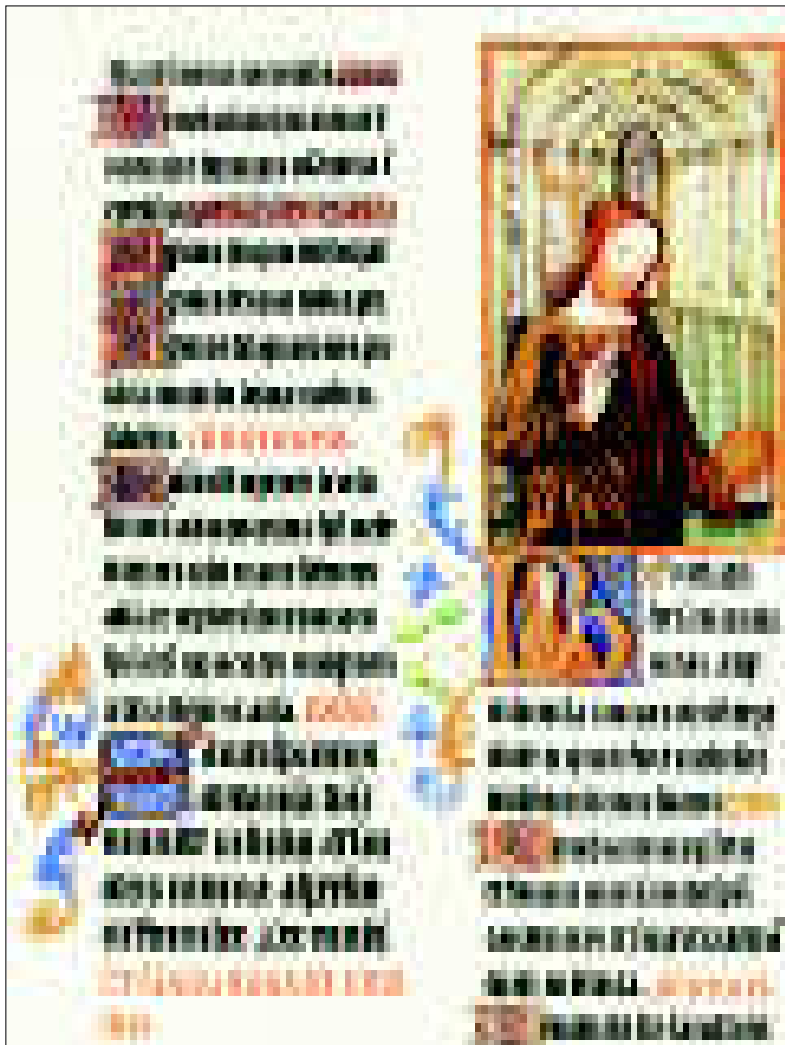
Les Très Riches Heures du Duc de Berry. Folio 188r. Kristus siunaa maailmaa. Christus Rex, Inc.

T otisesti on arvokasta ja oikein, kohtuullista ja autuaallista, että me aina ja kaikkialla kiitämme sinua, Herra, pyhä Isä, kaikkivaltias iankaikkinen Jumala.