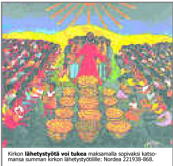
Kirkon lähetystyötä voi tukea maksamalla sopivaksi katsomansa summan kirkon lähetystyötilille: Nordea 221938-868.