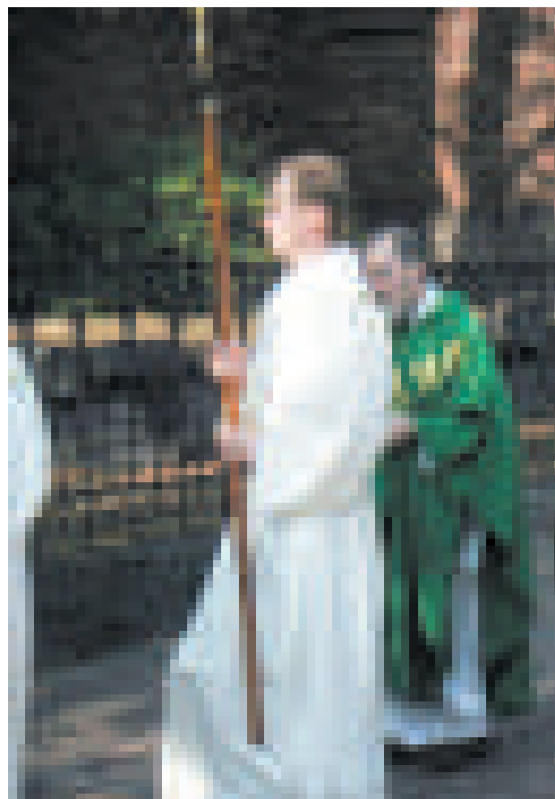
Kirkkovuoden tavallisen ajan liturginen väri on vihreä.

Viime Herran kasteen juhlan jälkeen päättyi jo jouluaika, samalla kirkko on astunut vuoden tavalliseen aikaan, joka sijoittuu oikeastaan kahdena jaksona joulun ja pääsiäisaikojen välillä vuorotellen. Sana 'tavallinen' viittaa siihen, mitä yleensä tai normaalisti tehdään. Se kuulostaa usein esiintyvältä, yleiseltä ja totunnaiselta tapahtumalta, jolta ei odoteta mitään erityisen uutta. Eihän tavallisella ajalla ole omaa erityistä korostusta, vaan silloin vietetään tavanomaisesti Kristuksen salaisuutta koko sen täyteydessä, varsinkin sunnuntaisin. Jeesuksessa Kristuksessa on itse asiassa Jumalan ilmoituksen täyteys ja lopullisuus (DV 2). Kristus, Jumalan ihmiseksi tullut Poika, on Isän täydellinen ja lopullinen Sana: "Monet kerrat ja monin tavoin Jumala muinoin puhui isillemme profeettojen suulla, mutta näinä viimeisinä aikoina hän on puhunut meille Pojassaan" (Hepr. 1:1-2). Hänen jälkeensä ei enää anneta muuta ilmoitusta, koska hänessä Isä Jumala on sanonut kaiken, eikä muuta sanaa ole olemassakaan. Pyhä Ristin Johannes korostaa vielä selvästi: "Se joka Pojan tultua haluaisi vielä kysyä Jumalalta jotakin