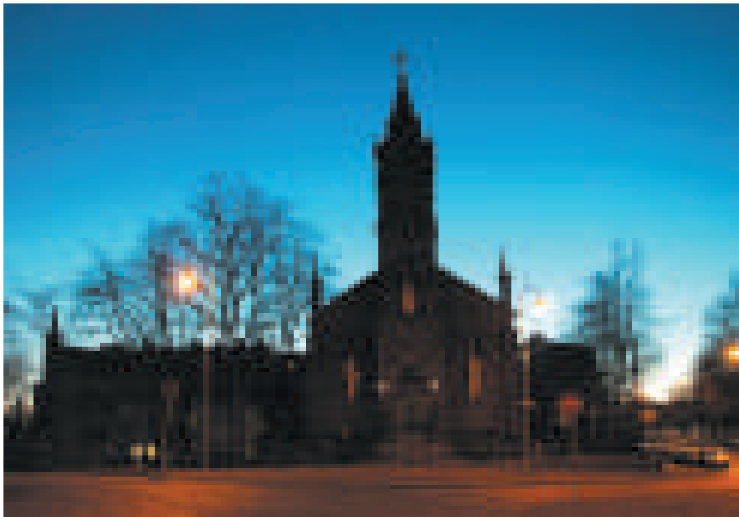
Pyhän Henrikin katedraali on vanhin seurakuntakirkkomme, ja suojeltuna kohteena se olisi hyvin kallis kunnostettava.