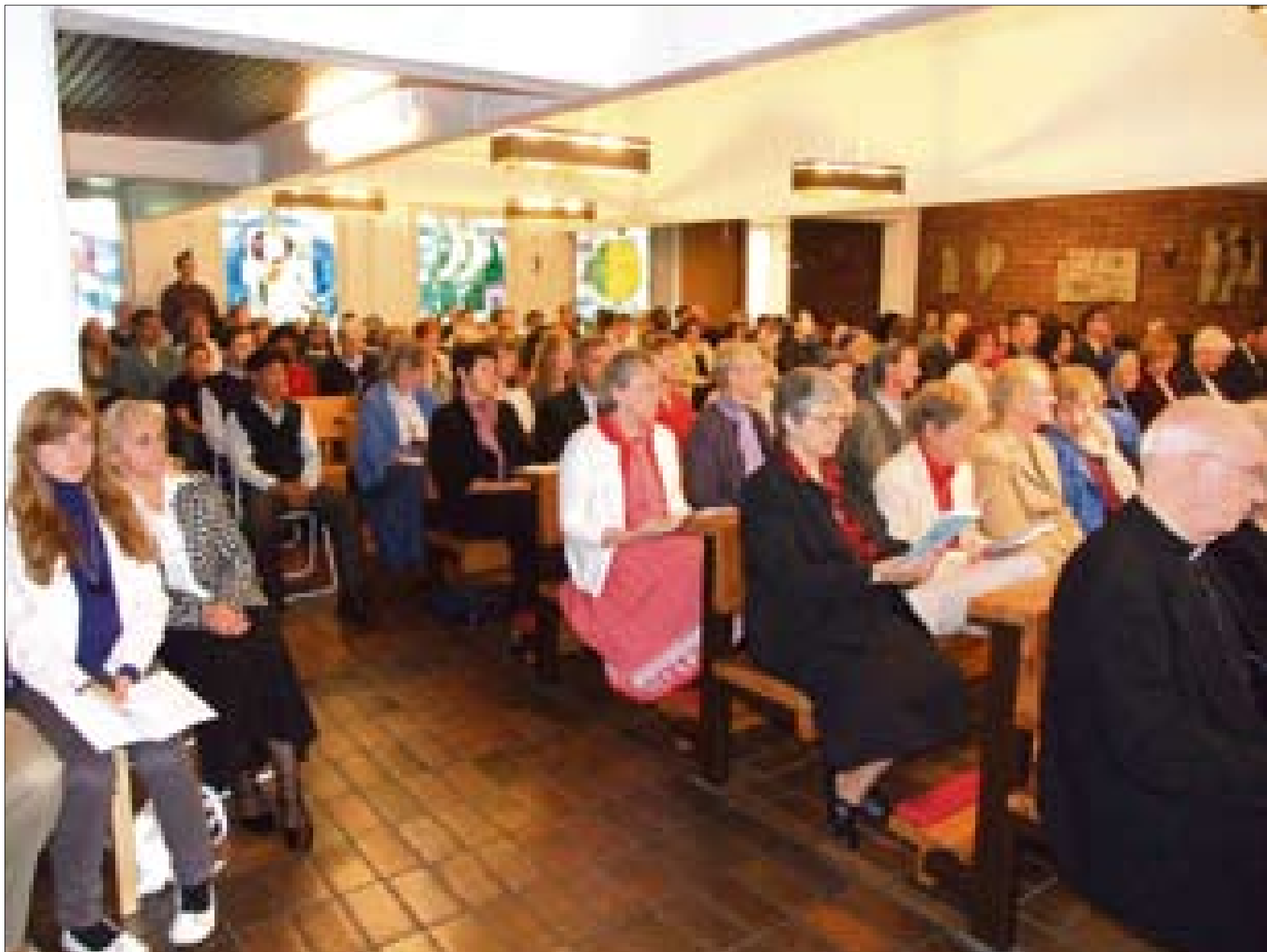
Pyhän ristin seurakunnan juhlamessu oli kerännyt pienen kirkkosalin ääriään myöten täyteen ihmisiä. Juhlapäivän tunnelmaa kuvasi yksi sana ylitse muiden: kiitollisuus.

T ampereen Pyhän Ristin seurakunta vietti viisikymmenvuotisjuhlaa 9.9.2007. Viisikymmentä vuotta on huomattavan pitkä aika. Noina vuosina Hattulan keskiaikaisen pyhiinvaelluskirkon perinnettä jatkavasta Tampereen Pyhän ristin kirkosta ja seurakunnasta on kasvanut vilkas keskus, jossa seurakuntalaiset osallistuvat pyhään eukaristiaan, tapaavat toisiinsa ja toimivat seurakunnan yhteiseksi parhaaksi monin eri tavoin. Juhlapäivän iloa lisäsi alkusyksyn auringon kirkas säteily, joka ei olisi voinut olla sähkövämpi.