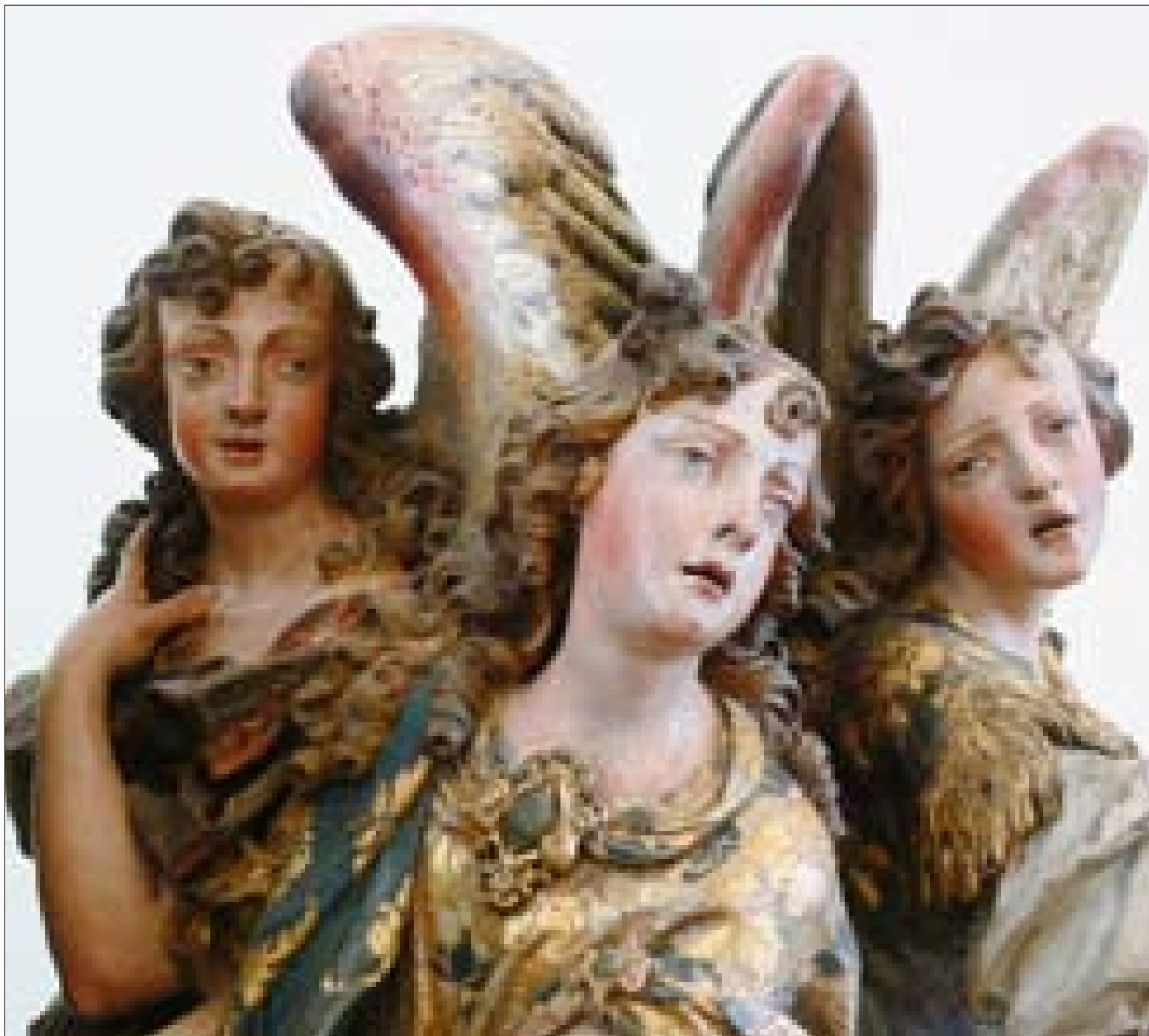
Pyhien suojelusenkeleiden muistopäivää vietetään lokakuun 2. päivänä.